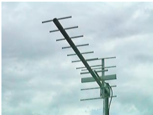
Na polarização horizontal