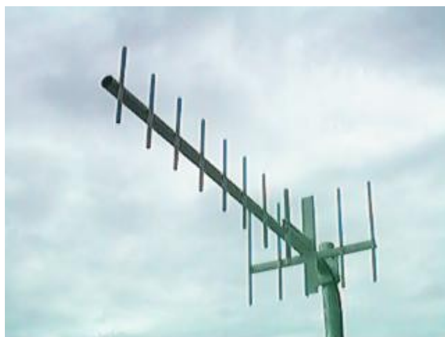
Na polarização vertical